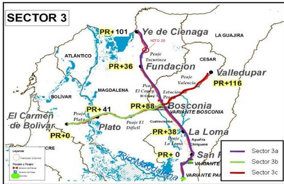
Figura 2. Ubicación del corredor vial sector 3