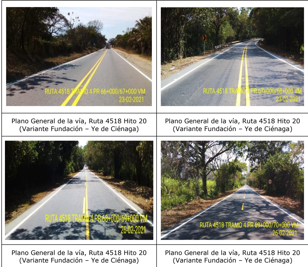
Figura 3. Registro Fotográfico