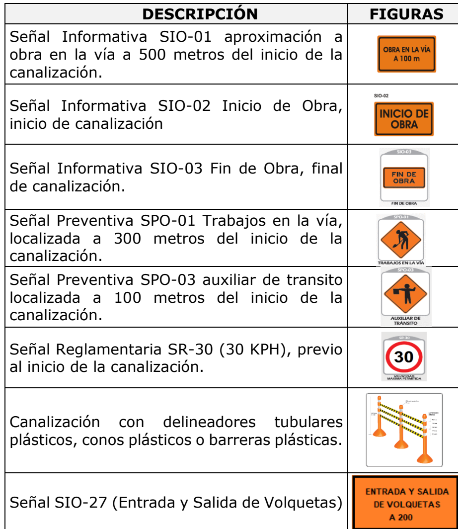
Cuadro 3 Señalización Propuesta