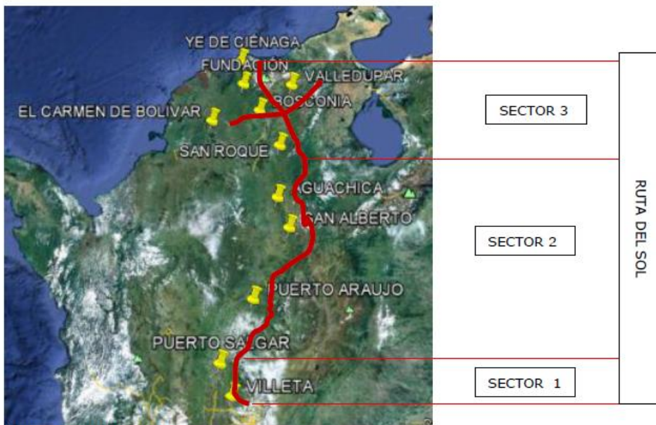
Figura 1. Ruta del sol